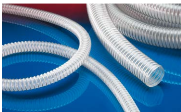
AIRDUC® PUR INOX 355 FOOD-AS