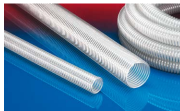
AIRDUC® PUR INOX 356 FOOD-AS