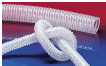
AIRDUC® PE 362 FOOD